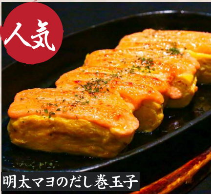
明太マヨのだし巻玉子