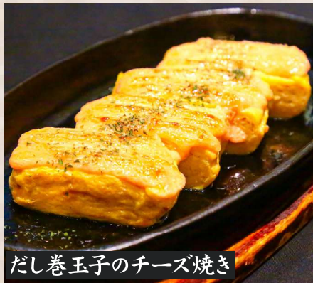
だし巻玉子のチーズ焼き