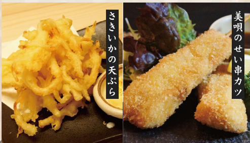
さきいかの天ぷら