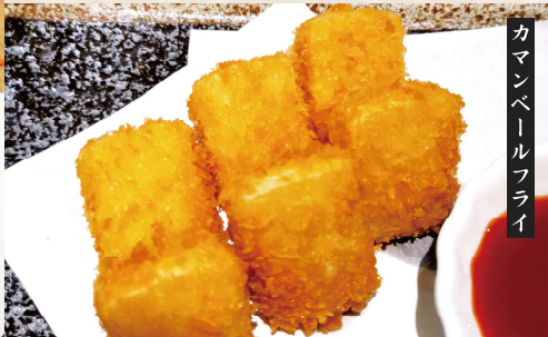
カマンベールフライ