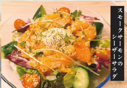
スモークサーモンのシーザーサラダ