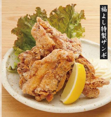
福よし特製ザンギ