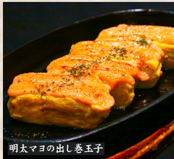
明太マヨの出し巻玉子