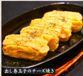
出し巻玉子のチーズ焼き